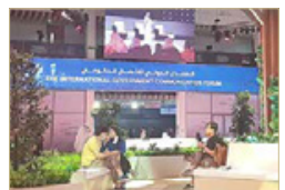
اهتمام إعلامي عالمي بالحدث

تحقيق التناغم بين الذكاء الاصطناعي والذكاء العاطفي والاجتماعي، وسيبحت المنتدى رؤية الارتقاء بكفاءة الموارد البشرية وتعزيز التفكير الإبداعي، بالإضافة إلى دور الاتصال الحكومي في