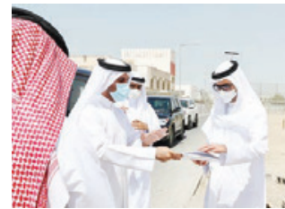
○ سمو محافظ الجنوبية خلال جولته التفقدية في منطقة الزقاق.

وفي ختام الزيارة، اطلع سمو المحافظ على عدد من المرافق العامة والمنشآت بمنطقة الزقاق، مشيداً سموه على أهمية رفع مستوى الخدمات العامة بما يريثيق إلى تطورات وروى المواطنين، حيثيات ذلك في سياق اهتمام المحافظة بالمشروعات التي تعكس الدور المجتمعي والتنموي بما يتماشى مع النمو العمراني الذي تشهده المنطقة.