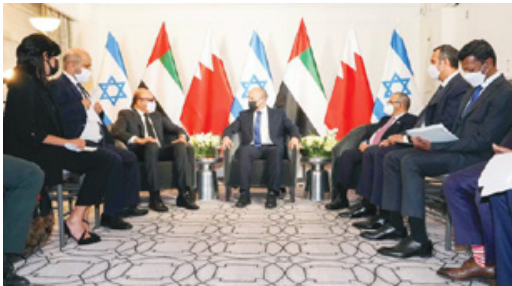
العربية المتحدة لدى الأمم المتحدة السفير محمد عيسى أبو شهاب.