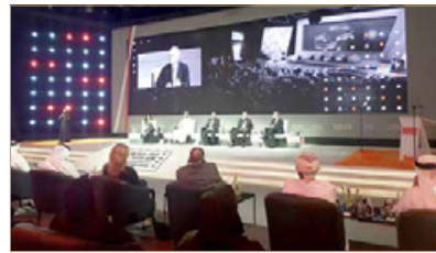
... وجوار فعالية وسائل الاتصال الحكومي