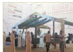
المندوب فتح المجال لحوارات جدلية