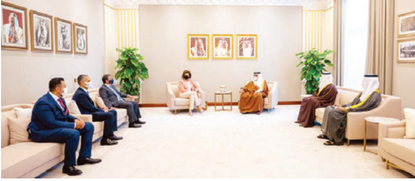
○ سمو ولي العهد رئيس الوزراء يستقبل رئيسة منطقة الشرق الأوسط وشمال إفريقيا لمجموعة سيتي بنك.