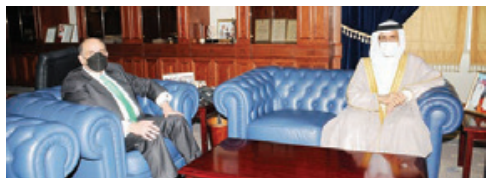
○ وزير التربية يستقبل السفير الأردني.

أكد صاحب السمو الملكي الأمير سلمان بن حمد آل خليفة ولي العهد رئيس مجلس الوزراء أهمية استمرار تعزيز دور القطاع المالي والمصرفي باعتبارها أحد القطاعات المهمة التي تسهم في رفد النمو الاقتصادي للمملكة وخلق مزيد من الفرص الاستثمارية الواعدة، متوفاً بالحرص على مواصلة تعزيز التسهيلات أمام الاستثمارات المختلفة بما