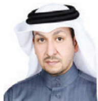
○ سلمان العامري.

أعلن المسجل العام بوزارة العدل والشؤون الإسلامية والأوقاف سلمان العامري عن فتح باب التقديم لتلقيه بجدول الوسطاء في المسائل الشرعية، وذلك بموجب القرار رقم (٩٦) لسنة ٢٠٢١ الصادر عن وزير العدل والشؤون الإسلامية والأوقاف بشأن تنظيم الوساطة في المسائل الشرعية.