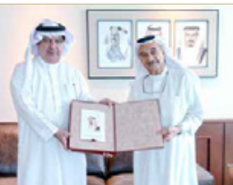
عبدالله آل خليفة بالجهود التي يبذلها الكاتب الصحفي جمال الياقوت في الصدى الإعلامي لمسار العلاقات الأخوية القائمة بين البلدين الشقيقين (المملكة العربية السعودية ومملكة البحرين)، وإسهاماته متمنياً الجهود الصحافية لأششطة المجلس الأعلى للصحة للتصدي لفيروس كورونا (كوفيد-19)، في إثراء الساحات الأدبية، من جهته، أعرب الكاتب الصحفي جمال الياقوت عن شكره وتقديره للفريق طبيب الشيخ محمد بن عبدالله آل خليفة على دعمه وتشجيعه للجهود الإعلامية والصحية.