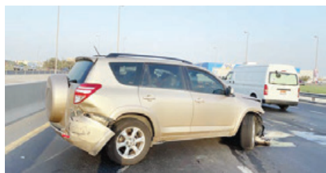
○ السيارة عقب الحادث.

وتعود تفاصيل الواقعة الجوهرة التي تبذلها الهيئة ومديرها إلى اعتماد توصيل البرغمين في بداخل بعض المناطق هناك من قبل إلا أنه بعد فتح الجسر مؤخرًا ازاد التوجه عبر الجسر ولكنه لم يكن قد أجري الفحص المقرر إجراءه قبل الوصول ٧٢ ساعة قبل الحضور سابقاً إلى مكتب الصحة بالجسر، كما كشف أمرهما بعد أن تبين تشخيص الفحص الذي تشيخه الفحص عن طريق كود QR حيث ظهرت نتيجة الفحص سلبية ولكن بيانات وتواريخ سابقة لتاريخ وصولها الجسر حيث اعترفا بالواقعة وتم إبلاغ الجانب