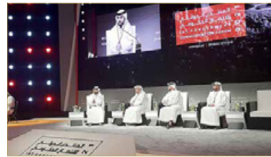
جانب من جلسة الوعي الجمعي