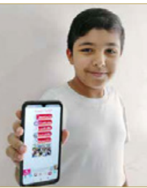
مشاركة اليريات رفيعا