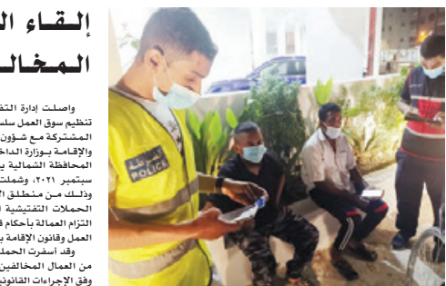
○ حملات تفتيشية من هيئة تنظيم سوق العمل.

وقد أسفرت الحملة عن القبض على عدد من العمال المخالفين الذين سيتم ترحيلهم وفق الإجراءات القانونية المتبعة. وأكدت هيئة تنظيم سوق العمل استمرارية وحرصها على تكثيف الحملات التفتيشية