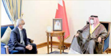
عبدالفتاح السيسي، تجسد مدى عمق ومثانة العلاقات الأخوية الراضخة مصر العربية الشقيقة، ولقاءه جلالته مع أخيه رئيس جمهورية مصر العربية

بين البلدين الشقيقين وما تتميز به من تواصل مستمر بين قيادتي البلدين وتنسيق مشترك حيال مختلف القضايا التي من شأنها تعزيز العلاقات بين البلدين الشقيقين ودعم العمل العربي المشترك وترسيخ الأمن والاستقرار في المنطقة. من جانبه، عبر السفير ياسر محمد شعبان، عن اعتزازه بقاء الشيخ خالد بن أحمد بن محمد آل خليفة، وتقديره لما يربط بين البلدين من علاقات قوية ووطيدة، متمنياً للمملكة البحرين المزيد من التقدم والرخاء.