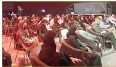
حضور جلسات اليوم الثاني

◆ اختفاء العقلاء والمعتبين له أثره السلبي في مناعة الوعي الجمعي