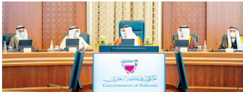
سمو ولي العهد رئيس مجلس الوزراء خلال ترؤسه جلسة مجلس الوزراء.

سموه: الجائزة تكريم دولي لإنجازات صنعها فريق البحرين بروح الفريق الواحد المجلس يهنئ السعودية بيومها الوطني ويشيد بما حققته من نهضة تنموية شاملة