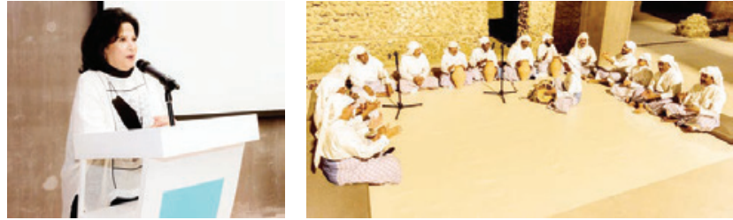
الشيخة مي آل خليفة

ومن بعد ذلك انطلقت الفعالية إلى سوق القيصرية، حيث شهد جولة للحاضرين لتتعرف على أهم ملامحه، والتاريخية والعمرانية. واستمرت فعالية الاحتفاء بيوم السياحة العالمي، حيث قدمت فرقة قارلس للفرقة الشعبية مشاركة تحت سقف مركز الزوار استعرضت فيها في الضحى المرتبط بعمارة صيد اللؤلؤ، واحد أهم ملامح صيد اللؤلؤ، والتي تشكلت رافعة اقتصادية للمجتمع المحلي والزوار على حد سواء، وذكر أن الارتقاء بالمكونات التراثية والثقافية في المنتجعات السياحية والمطاعم والمقاهي، وحالات وكنايس سيادي التي تمثل نماذج معمارية للمناجر السياحية التي كان يتكون منها معظم السوق.